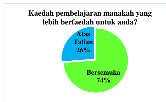
Rajah 3: Kaedah pembelajaran yang lebih berfaedah.

Rajah 3 pula memaparkan keputusan bagi soalan “Kaedah pembelajaran manakah yang lebih berfaedah untuk anda?”. Berdasarkan analisa di bawah, 74% peratus daripada responden memilih kaedah pembelajaran secara bersemuka lebih berfaedah untuk diri mereka berbanding pembelajaran secara atas talian. Hal ini menyokong dapatan oleh Gherhes et al (2021) yang disebut sebelum ini.