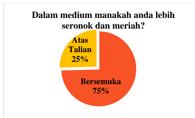
Rajah 2: Medium yang menyeronokan dan meriah untuk belajar.

Rajah 3 pula memaparkan keputusan bagi soalan “Kaedah pembelajaran manakah yang lebih berfaedah untuk anda?”. Berdasarkan analisa di bawah, 74% peratus daripada responden memilih kaedah pembelajaran secara bersemuka lebih berfaedah untuk diri mereka berbanding pembelajaran secara atas talian. Hal ini menyokong dapatan oleh Gherhes et al (2021) yang disebut sebelum ini.