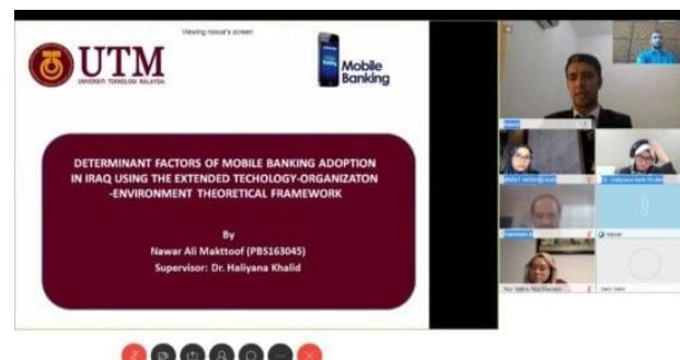
Rajah 2: Seperti sesi pembelajaran dan Pengajaran, peperiksaan lisan Viva-Voce juga dijalankan secara dalam talian susulan COVID-19